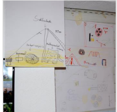
Ideen der Kinder auf Papier gebracht

In einem halbtägigen Kinderworkshop entwickelten und präsentierten rund 15 Kinder ihre Visionen von bewegungsanregenden Spielgeräten für den neuen Spielplatz auf dem Gelände des TuS Glane . Sie besichtigten das Gelände und machten eine Bestandaufnahme, im Anschluss wurden die Visionen auf Papier gebracht und erläutert. Mit Unterstützung der Stiftung konnten diese Kinderwünsche in die Realität umgesetzt und am 16. Juni 2018 beim großen Eröffnungsfest des gesamten Sportparks der Öffentlichkeit präsentiert werden.