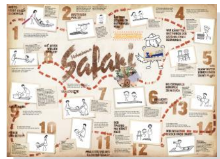
Safari-Plakat jetzt zum Ausmalen!

Für das Projekt haben wir außerdem das Wohnzimmer-Safari-Plakat angepasst und arbeiten derzeit an einem Bewegungsspiel für die ganze Familie und einer Stadtteil-Broschüre mit allen Bewegungsmöglichkeiten.