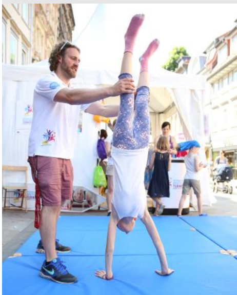
Mitmach-Stationen auf dem Erlebnis-Pfad beim Erlebnis Turnfest 2016 in Göttingen

Auf der Webseite gibt es das Antragsformular für Fördermittel sowie jede Menge nützliche Unterlagen zum Download . Bei Fragen oder für eine Beratung steht die Geschäftsstelle der Stiftung jederzeit zur Verfügung.