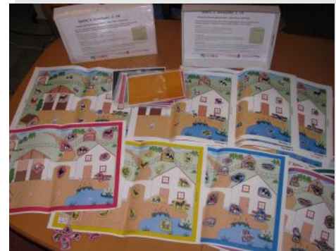
Die Materialien aus dem Themenkoffer Sport, 1. Klasse

Das vom Vorstand 2016 bewilligte Projekt „Bewegtes Lernen durch die spielerische Kombination von Laufen und Orientieren“ fand in diesem Jahr seinen erfolgreichen Abschluss. Insgesamt konnten 12 Grundschulen aus Südniedersachsen und Hannover an der Lehrerfortbildung zur Thematik teilnehmen und erhielten darüber hinaus die Materialienkoffer für 16 Unterrichtseinheiten in den Fächern Sachkunde und Sport. Alle Koffer wurden mit Liebe zum Detail per Hand erstellt, an das Kerncurriculum angepasst und begeisterten so nicht nur die LehrerInnen.